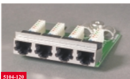
5104-120 4-port Modul