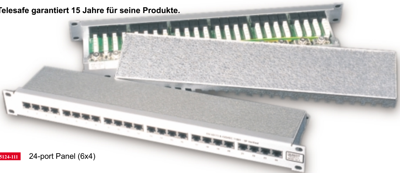
5124-111 24-port Panel (6x4)

Telesafe garantiert 15 Jahre für seine Produkte.