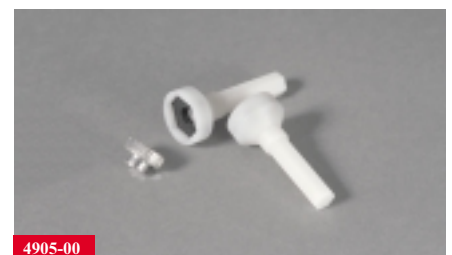
4905-00 Werkzeug für Rändelmuttern

Bestellinformationen und elektrische Werte siehe Rückseite